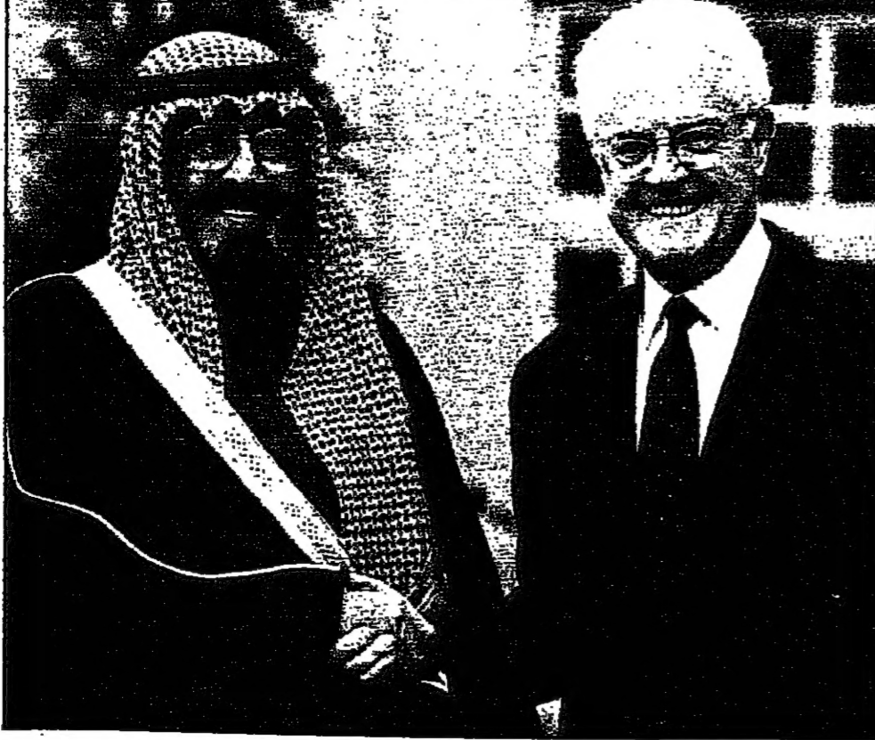
رئيس الوزراء الفرنسي ليونل جوسبان لدى استقباله ولي العهد السعودي الامير عبد الله

بجهد في الواقع في فرنسا حيث تجري داخل قاعة رياضية مهيأة محاضرة 138 شخصاً من التشبيبه بهم باتهم من الاسلاميين، وكلمهم من دول شمال افريقيا. وينسب القضاء الفرنسي الى هؤلاء مجموعة من التهم تتراوح بين تزوير وثائق الإقامة والهوية، والاتصاف الى جماعات اراهابية، وتقديم الدعم للمادري والليال للجماعة الاسلامية المسلحة في الجزائر. وقد اثيرت هذه المسألة انتقادات وردود فعل لثلاثة من قبل المنظمات الحقوقية ويحضر رجال القضاء الفرنسي الذين دعوا الى وقفها.